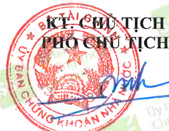
Lương Hải Sinh